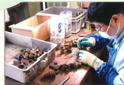
謎解きのドキドキ感も