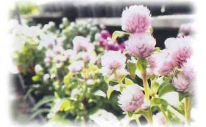
花の色を長く楽しめる千日紅