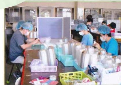
シンプルな工程 少人数で作業完結