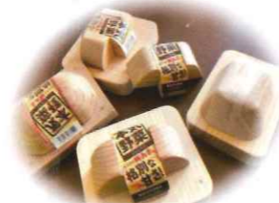
木材を再利用した園長のお手製

同一製品を数多く生産する・同じ工程を繰り返し行うラベル貼り作業。ポイントは、品質管理の安全性とバラツキのない精度の高さ、そして作業効率を高めるスピード感。この目的のために資材を位置決めし、固定して作業を行える機能を持つ補助具が「じく(治具)」。