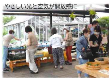
気ままにぶらっと～ポポロ