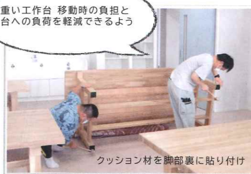
重い工作台 移動時の負担と 台への負荷を軽減できるよう