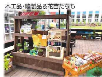
木工品・縫製品&花苗たちも 手づくり製品 花の実ブランド