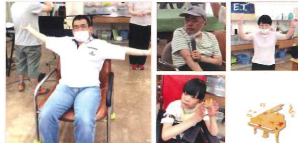
体に心に響き合う 全身の表現活動