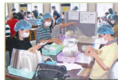
作業スペースは 衛生的な環境に配慮