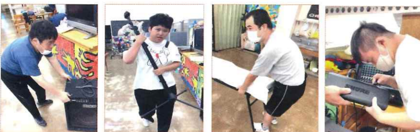
どんな活動も「利用者さんと職員が共に手分けして」準備と片付けを行っています

曆に季節感をちりばめた素敵な製品をお届け出来るよう協力して制作していきます！11月中旬頃から販売予定 ～ 楽しみにお待ちくださいね～