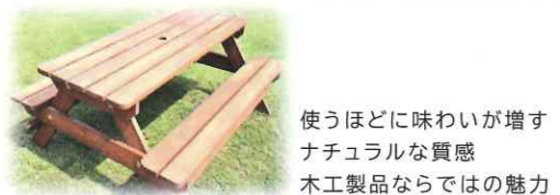
使うほどに味わいが増す ナチュラルな質感 木工製品ならではの魅力