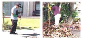
陽差しの下の草刈りもチームワークで