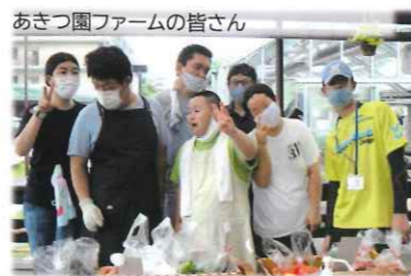
あきつ園ファームの皆さん 生産者の顔が見える安心感