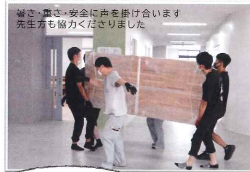
暑さ・重さ・安全に声を掛け合います 先生方も協力くださりました