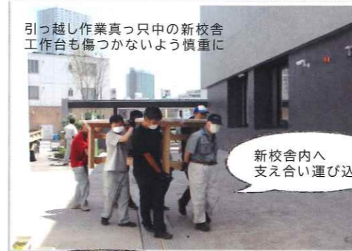
引越し作業真っ只中の新校舎 工作台も傷つかないように慎重に