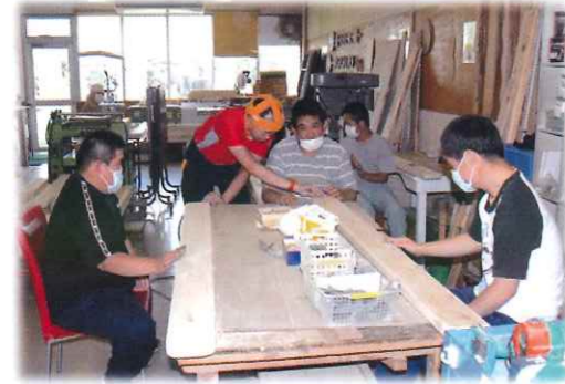
創造力と技術力のクリエイター