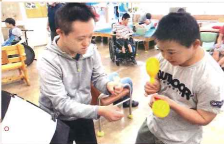
曲の合間いつもの二人で掛け合います