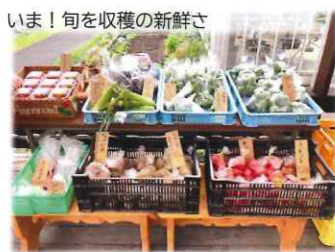
いま！旬を収穫の新鮮さ 採れたて野菜の彩りと品揃え