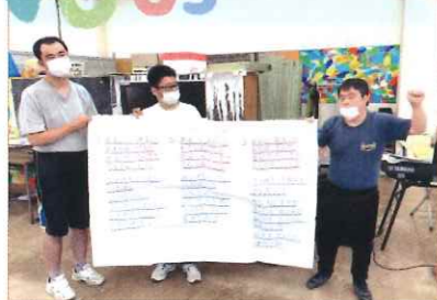
音を楽しむ活動で地域交流を