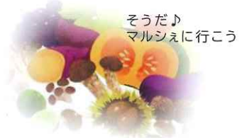
そうだ♪ マルシェに行こう

朝夕の涼風に秋への移ろいを感じます。気温の変化や暑かった夏の疲れも出て体調を崩しやすい季節です。食事も冷たいものから温かいものへ。これから収穫時期を迎える「いも類、豆、そば、栗、くるみ」は栄養価も高く、体を温めてくれる旬の食材です。積極的に採り入れて、代謝機能 & 免疫力アップ！！