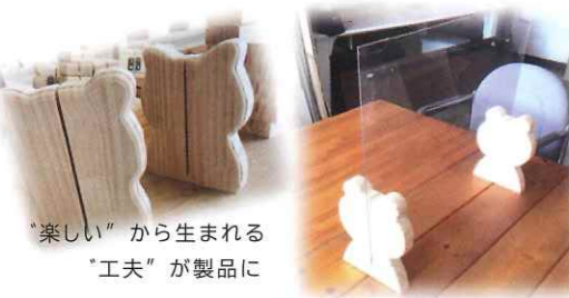
“楽しい”から生まれる “工夫”が製品に