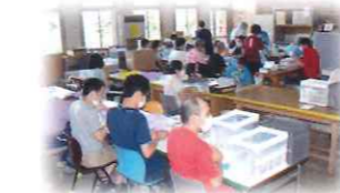
成果品は日々の努力と汗の積み重ね

新型コロナウイルスの影響による、空前の手作りマスクブームから、手芸店から「スパンミン糸 #60 白色」が品薄＆購入個数制限？！来年度も変わらず防災頭巾販売が出来るように手芸ショップを回ってミン糸を探しております。お心当たりの方は是非花の実園縫製担当まで！