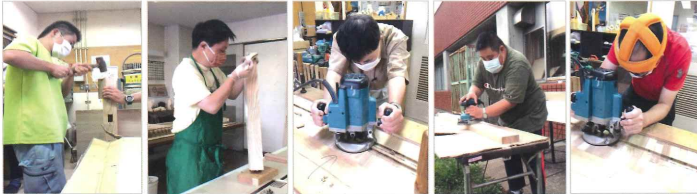
木工班の精鋭 探求心と集中力でお客様に喜んでいただける製品づくりへ

新年度のスタートと共に、保育・教育の現場から次々と製作依頼を受注してきた木工班。オーダーは感染対策の渦中であって飛沫防止ボードなど、求められるモノも変化しています。熟練の木工職人達が磨き上げてきた技術と製品への思いは、木の温もりに人の優しさと心を伝える手仕事のこだわりで刻まれています。「児童・生徒さんが笑顔になるように」そんな願いと想いを込めた製作ドキュメントに迫ります！