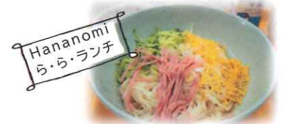
「冷やし鉢風そうめん」 涼やかメニューでクールダウン