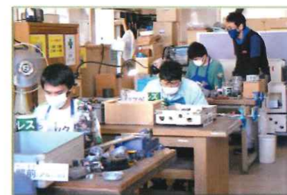
省エネ・小型化・高性能 部品のすべてが宝の山